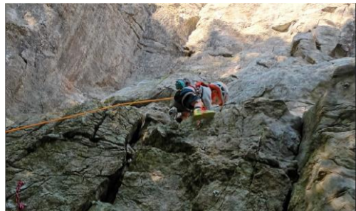
Luca in der Roten

Der grosse Teil des Sektors wurde gereinigt und einige Routen wurden komplett saniert. Im linken Teil konnten noch drei Routen neu erschlossen werden. Sämtliche Routen wurden am Einstieg neu angeschrieben. Die farbigen Routen im Vorbau befinden sind im unteren Schwierigkeitsbereich. Es wurden Stände für das Üben in Mikroseillängen, Flaschenzüge etc. eingerichtet. Weiter eignen sich die Routen auch für Kinder. Das Material wurde durch ReBolting zur Verfügung gestellt.