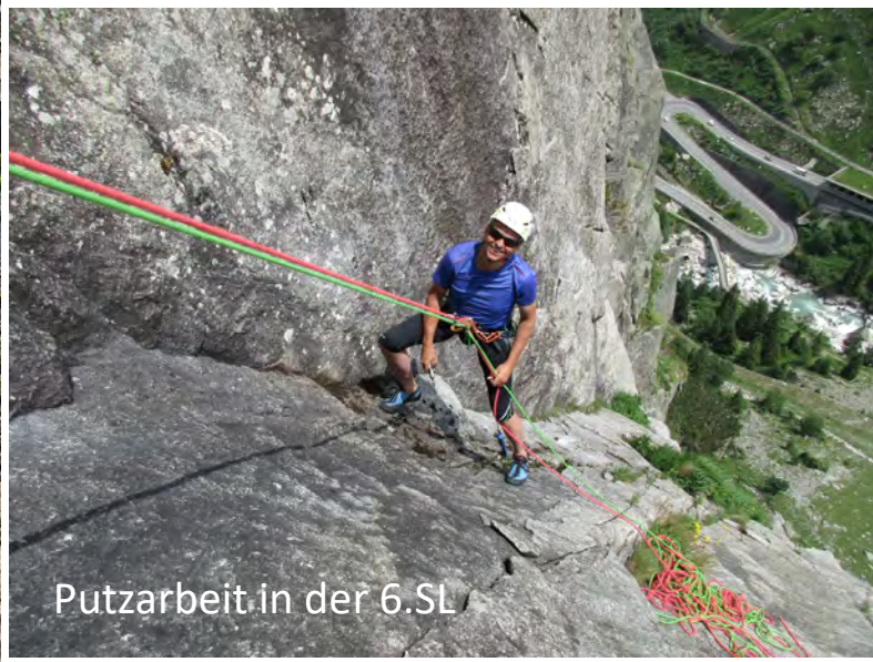
Putzarbeit in der 6.SL