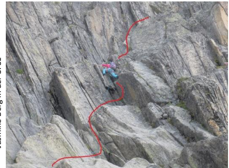
Jasmine Berg in der 3. SL