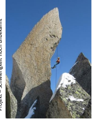
Projekt – Schwierigkeit noch unbekannt